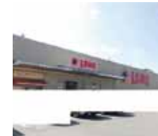
ラムーまで430m(徒歩6分)