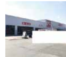
F1 マートまで400m(徒歩5分)