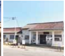
高茶屋駅まで880m(徒歩11分)