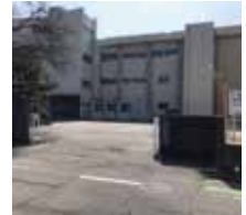
南郊中学校まで430m(徒歩6分)