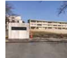
高茶屋小学校まで870m(徒歩11分)