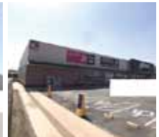
オークワまで610m(徒歩8分)