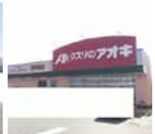
クスリのアオキまで430m(徒歩6分)