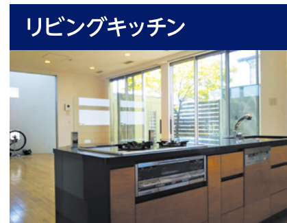
ワイドなテラスに面した自然光広がる明るいLDKです。