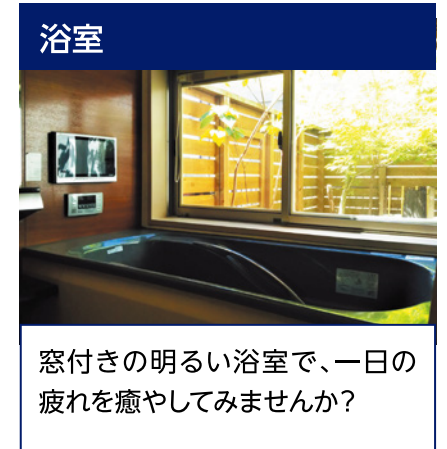
窓付きの明るい浴室で、一日の疲れを癒やしてみませんか?