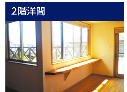
木の温もりが優しい、採光の明るい洋室です。